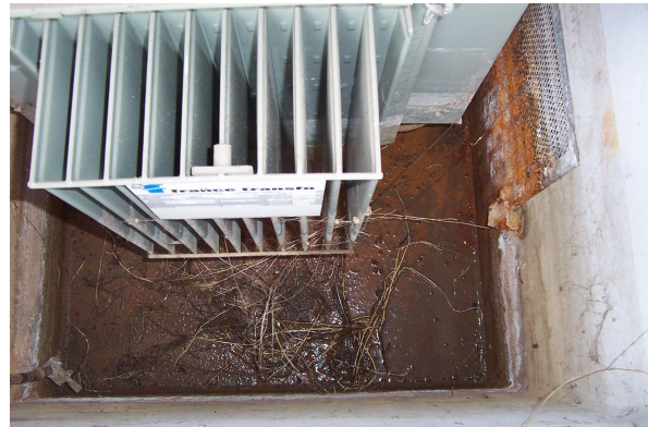
Bilder einer schlecht gewarteten Kompaktstation